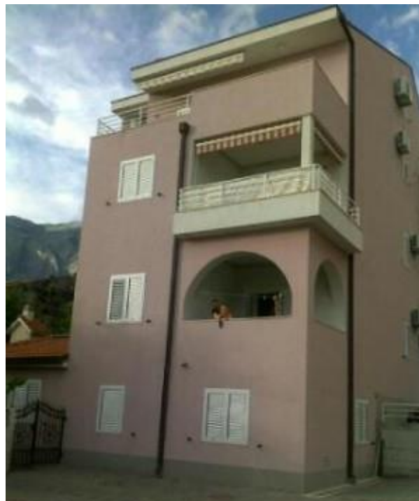
Avskjed med/i Promanija.

( www.jadronlinija.hr ) meldte at hurtigferja (katamaran) er inntilt på grunn av dårlig vær. Så da blir det nattferje som antydnet i går. Etter at ST1 hadde løst inn billett på fire-sengs kabin, uten dusj og do, til seg sjøl, samt plass for ST1300 om bord, ba ST1 om at sjøsjuketabletter måtte medfølge til prisen for hele herligheten på 1.752 kuna (lokal valuta: ca 1 norsk krone for 1 kn). Men neida – fremdeles den hyggelige damen (alltid sånn) – meldte da at uværet ville gi seg, at den store ferja "Dubronvik" naturligvis hadde så bra stabilisatorer