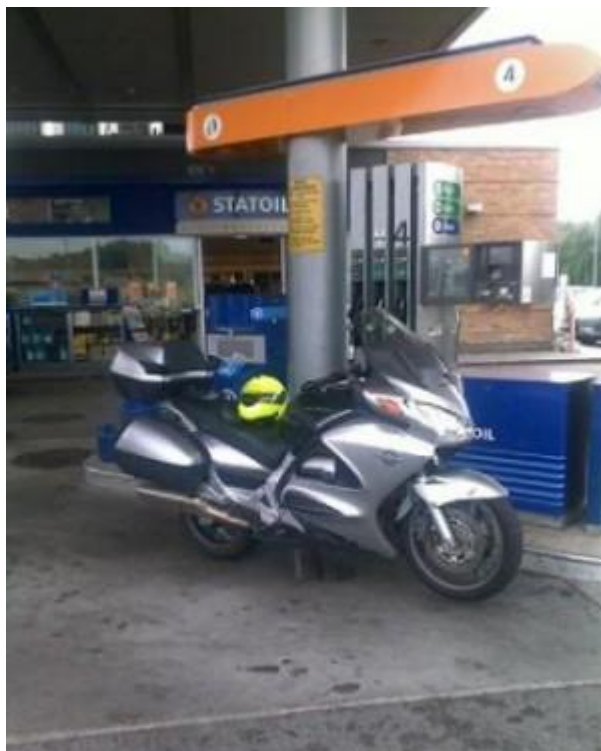
Siste påfyll for ST1300 (Kopstadkrysset) før turens endepunkt.

Fra Tønsberg gikk det strake vegen til Auma. Rolig dagsetappe, uten de store hendelsene å skrive om, men kikk på dagens bilder.