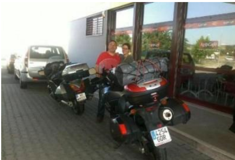
Et spansk mc-par på veg hjem.

Hva har dette med Toscana å gjøre? Absolutt ingen ting – men det skal legges til at ST1 i sin barndom og meget tidlig ungdom, fulgte stadig med i skipslistene gjengitt i Sandefjords Blad,