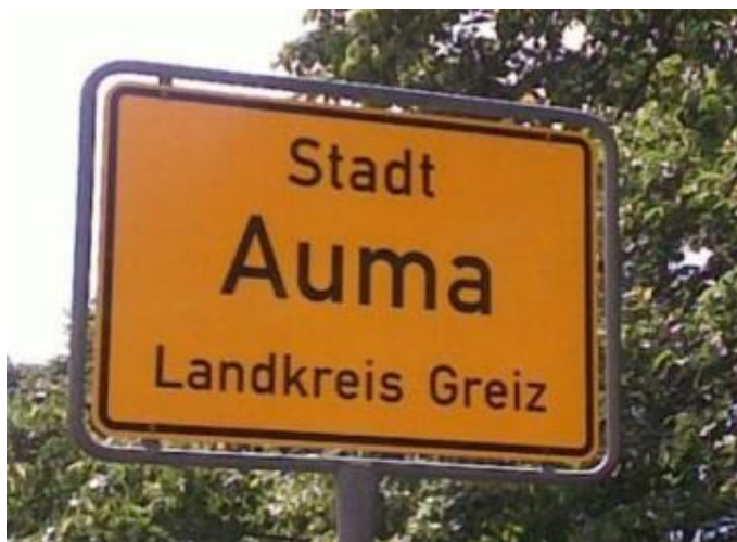
Auma i gamle Øst-Tyskland

Mandag er dagen da det ble en rolig dag her på Gasthof "Zur Linde". Dels fordi det var planlagt, men også for at godværet i