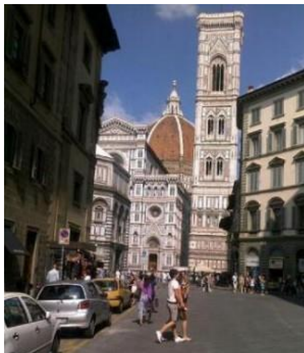
Minne nr. 2 fra Firenze-vakkert bvgg!

Avstandene i støvlandet likner veldig på tilsvarende avstander andre steder, bare at det er mer av alt – også køer, som utmerker seg med å være dels stillestående, dels sakteflytende i uordnet rekkefølge, dels mange og skumle. Men ST1300 og ST1 er nå altså i klatremodus og har tilbakelagt vel 510 km i dag, derav minst to timer i stillestående kø i og utenfor tunneler mellom Genova og franske grensa, med ca 25-29 grader ° . Da var det godt å kunne vinke farvel til Italiens land rett etter San Remo sånn ved halvfiretida og føle den franske trafikkkulturen på pulsen. Jammen var det rush der åsså, men like fullt vart Monaco, Nice, Antibes og Cannes passert i rimelig god stil! Albert ville nok ikke ta i mot en illeluktende mc-ist, så det kan utstå til en mer passende anledning.