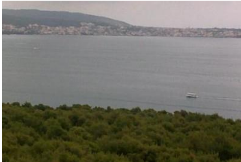
Trogir sett fra Medena