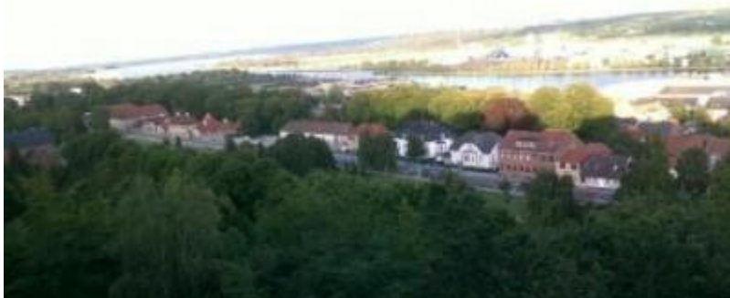
Randers 26/6-10 kl. 20.50 etter at Ghana har tatt ledelsen mot USA i fotball-VM's ene åttendedelsfinale.

Dagens helt korrekte påminning stod trafikkipolitiet for. Danske kroner 15 hundre for fortkjøring – overskridelse av fartsgrensa med 18 %. Ikke bra, og slike påminnelser er viktige før det skjer noe mer gæli. Ellers så er tilbakelagt kjøredistanse 9,83 hundre kilometer med start fra Luxembourg og endepunktet vart Randers. Fru GPS har vært trofast hele turen – sørget for en passe dose som vekslet mellom Bundesweg og Autobahn, mellom helt stillestående køer og tilnærmet uten trafikk. Gjennom Hamburg var det lange køer, knapt nok bevegelse, men i motsetning til det en opplevde i Genova, var det svært korrekte plasseringer i køene, ingen prøvde seg, og to kjørefelt var to kjørefelt; ikke fire som i Firenze. Imidlertid var ST1300 inspirert av italienske scooterprofileringen og forsøkte å benytte midtfeltet for å forsere og redusere køa. Sammen med en sveitser (med et av disse anerkjente bayerske