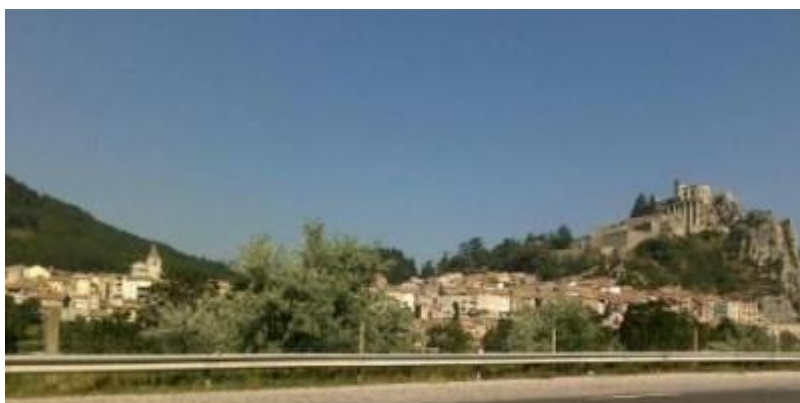
Et vakkert beliggende kloster langs Napoleons rute.

men denne er det verdt å ta en gang til.