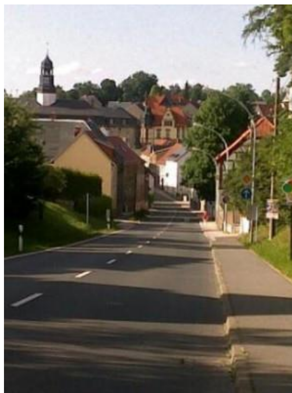
Auma sentrum med hovedgate.

Da jeg kom til Auma i går bestemte ST1 at ST1300 skulle gjennom en skikkelig vask. ST1 kjører en sånn rutine daglig på seg sjøl, mens ST1300 har klart seg med det naturlige ovenfra. Verre var det med det som kom fra sjøen – og det var på tide å skylle bort saltet. Vart det vask? Neida, det ville ikke bensinstasjonsdama – det var nemlig søndag - og da vasket man ikke. I stedet så ble ST1300 ren og vakker i dag! Nesten utrolig!