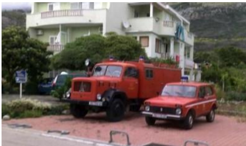
Brann- og redningssetaten i Promajna.

Himmelen åpner seg og slipper frihetene løs. Lyn og tordenskrall slåss med hverandre om å ryste omgivelsene, elektrisiteten kuttes, regn strømmer uavbrutt ned i store mengder, gatene