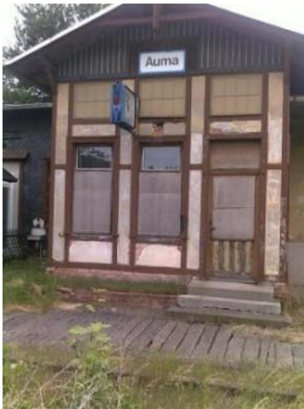
Om jernbanen er nedlagt, er i hvert fall stasjonsbygningen igjen på/i Auma

områdene som er tilbakelagt. Dette er tydeligvis en god energikilde, men det bør vurderes om ikke vannkraft er mindre stygt å bygge ut enn å sette opp digre vindmølleparker. Kanskje løsningen er et helt annet sted; med noe reduksjon i energiforbruksøkningen?