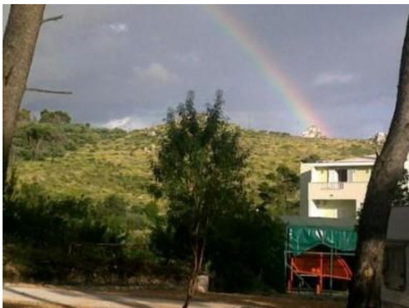
Etter regn .....