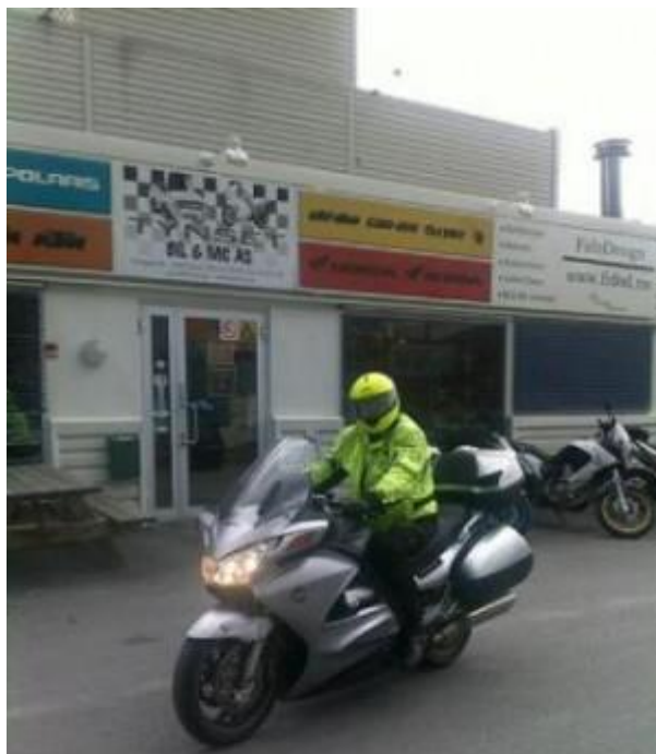
Turens endepunkt – og klart for 36000 km-service!

Det bør bli en tur til – hvorfor ikke ha seks delmål en sommer – nemlig å sveipe innom alle statene i i Europa som er mindre enn 500 km 2 : Andorra (468), Malta (316), Liechtenstein (160), San Marino (60,6) Monaco (1,95), og Vatikanstaten (0,44)? Kjører gjerne sammen med noen.