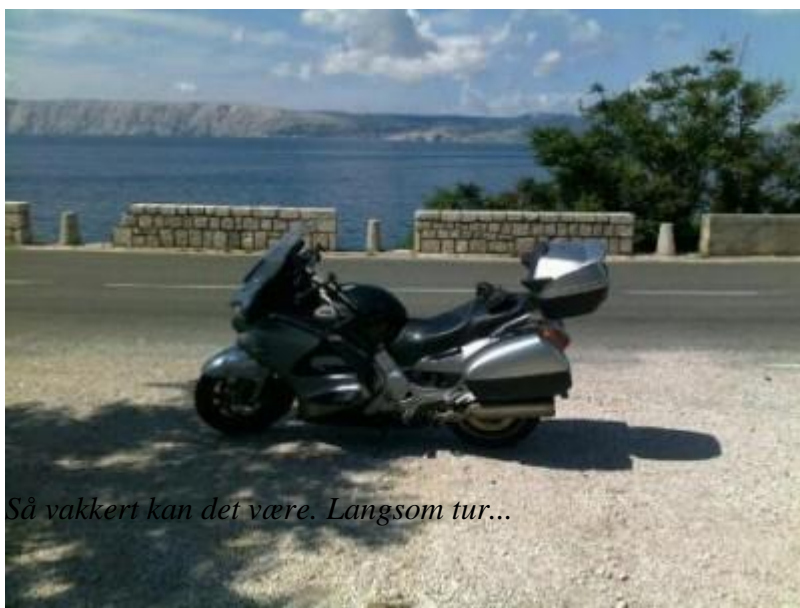
Så vakkert kan det være. Langsom tur...

Og nettopp Adriaterhavet har vært følgesvennen i dag. Ca 45 mil – svært mye av dette langs kystvegen. Det er pent her – mulig at det finnes et vakrere ord – vakkert kanskje? Kommer ned fra høyden – ser ei kyststripe – nærmest en lagune, med teglsteinsrøde tak på husene.