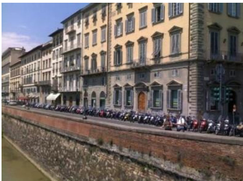
Noen scootere ved hovedvannvegen i Firenze.

Relativt lite med motorveger i dag – dog noen mil på slutten. Det mest utfordrende må nok