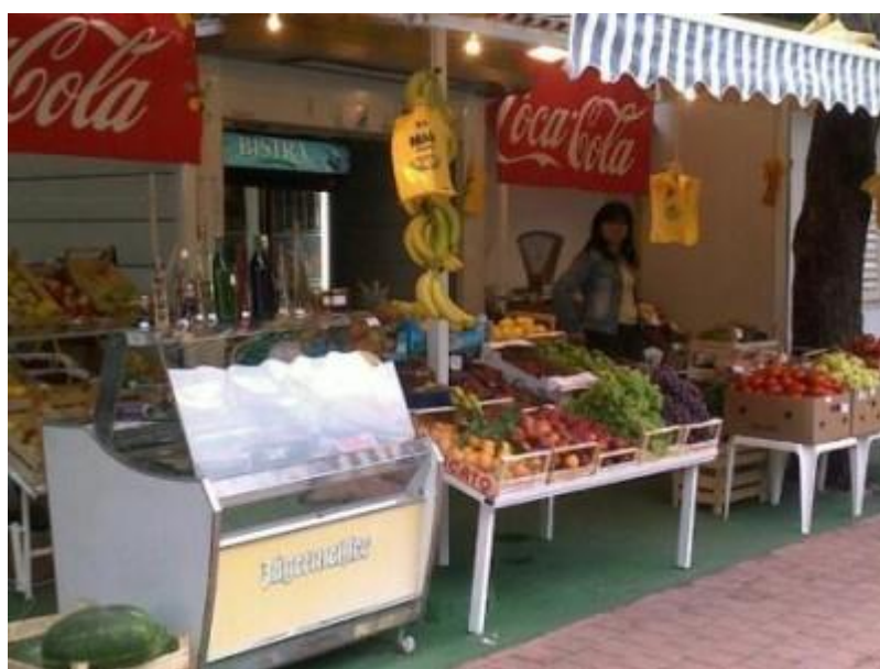
Is, frukt og grønt.

Når turen fortsetter tirsdag i retning Toscana, planlegges det ferje over Adriaterhavet fra Split til Ancona. Det er ikke bestilt plass, men satser på at en kan få en liten parkeringsflik til ST1300 og at ST1 eventuelt får ta til takke med å sove på dekk. Dette er nemlig nattferje. Og dermed er returen i gang.