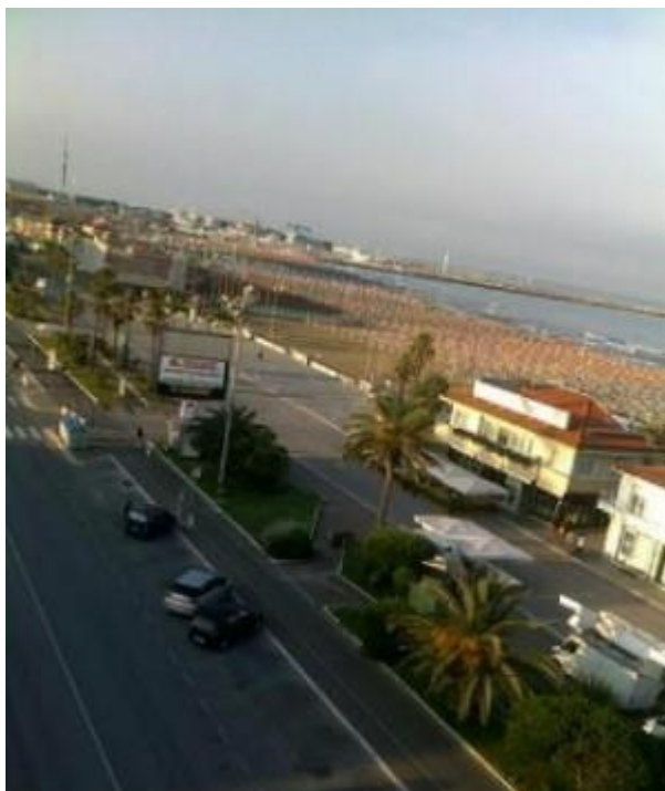
Morgenstemning 24/6-10 kl. 06.00 i Viareggio

Det er veldig spennende å adoptere ei rute fra en annen som har kjørt den – og snu den. ST1 har konsekvent fulgt fru GPS hele turen, nesten da, for i et par episoder var det ingen grunn til å erobre ødemarka til ny veggrunn. Men fru GPS har altså ført ekvipasjen trygt til Digne-les-Bains i kveld. Der fikk ST1 det siste rommet; dvs det uoffisielle rommet, mens ST1300 fikk (igjen) æresplass utenfor hovedinngangen. Denne lille byen – ca 10 mil fra Cannes og 20 mil fra Grenoble, har kongress i disse dager. Derfor litt enkle kår, men overhodet ingen grunn til å diskutere pris eller standard. Rom med dusj på rommet – toalett i gangen, og grande frokost i morra kl 08.00. Så enkelt – og i tillegg herlig middag på et anbefalt spisested rundt hjørnet, som viste seg å ha en utmerket forstand på kalvekoteletter med en særdeles frekk appelsinmontert saus attåt. Bare godt! Da hadde jeg glømt å nevne desserten som toppet det hele: creme brûlée.