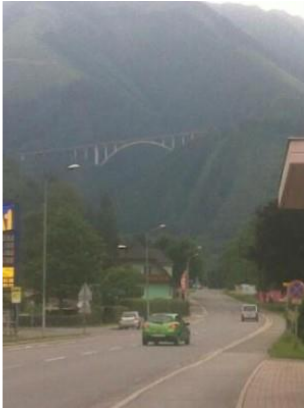
Denne brua vart forsert før dagens høydepunkt på 1265 moh.

Natten tilbringes på Gasthaus Fisherwirt ( www.hotel-fischerwirt.com ) – et meget godt spisested – og ikke minst hvor verten synes at ST1300 skal få den beste overnatting; nemlig innelåst i vertens egen garasje! ST1 mesket seg med helt ferske asparges dandert med nypotet, spekeskinke og hollandaise. Utsøkt!